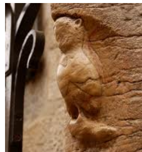
La Chouette chérie des Dijonnais